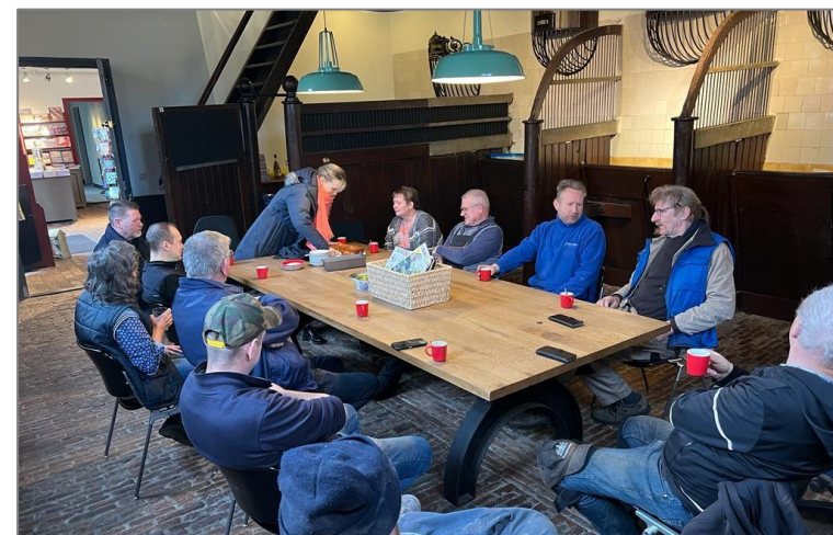
Vrijwilligers en aannemers aan de koffie op de maandagmorgen.

Het verbeteren van de klimaatbeheersing en verduurzaming van de keuken is in 2022 uitgedacht en aanbesteed. Een nieuw inductie afzuigstelsel zal worden geïnstalleerd.