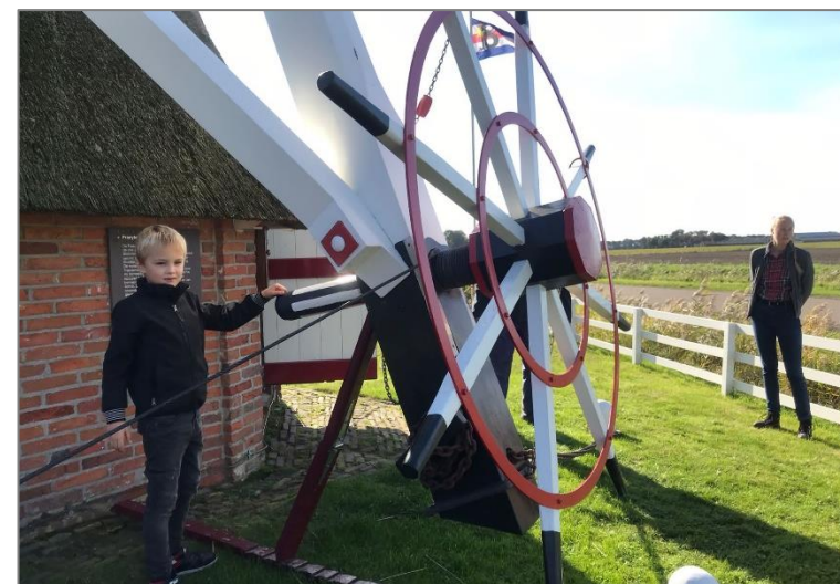
Samenwerking met de Molenstichting tijdens de Molenwandeling.

Er is een nauwe samenwerking met instellingen als Erfgoedpartners en K&C (Kunst en Cultuur). Zij zorgen er mede voor dat scholen ons en ons educatieaanbod weten te vinden. Er is een intensief contact met cultuurcoördinatoren en docenten van scholen voordat een schoolklas de Fraeylemaborg bezoekt. We werken vaak op maat: educatieve programma's worden aangepast aan het niveau van de groep of aan het thema waar de school de nadruk op wil leggen. Daarnaast wordt er samengewerkt met instellingen als de Molenstichting Midden- en Oost Groningen, Het Kielzog en andere culturele instellingen. Educatied medewerkers van het Klooster Ter Apel bezochten ons voor een "kijkje in de keuken". In april werd er een tegenbezoek gebracht.