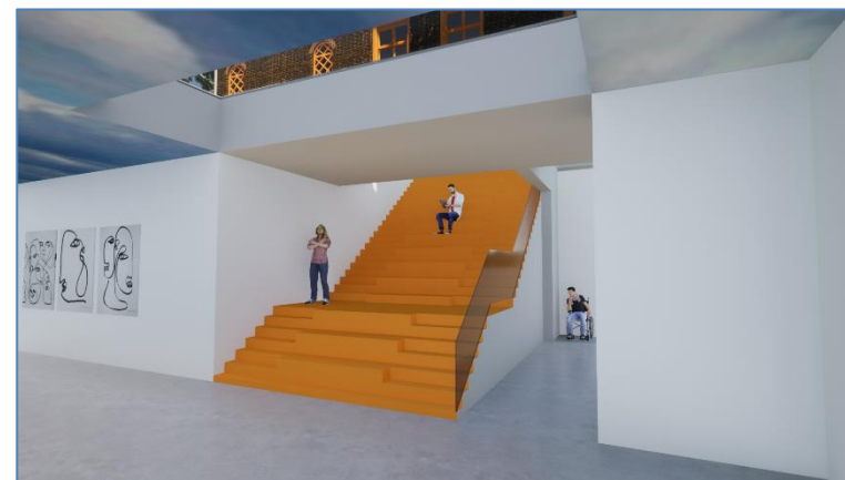
Artist impression ondergronds expositiepaviljoen trap naar Koetshuis met museumbalie, winkel, toiletten en garderobe.

Al met al gaat het om een investering van 5,1 miljoen. Bij realisering hebben we dan een expositieruimte van 800 m 2 in plaats van de huidige 130 m 2 . In het Koetshuis komen de museumbalie, de winkel, de garderobe met kluisjes en de toiletten. De