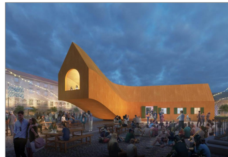
Artist impression Fuggerei Folly.

De folly zal maximaal tien jaar op het landgoed blijven staan. We zullen er goed op passen zodat de Fuggerei folly daarna naar een andere mooie plek kan, bijvoorbeeld naar het Roegwold in de gemeente Midden-Groningen.