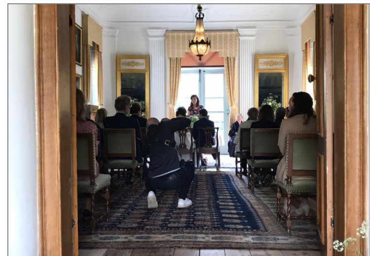
Huwelijksvoltrekking in de Grote Zaal.