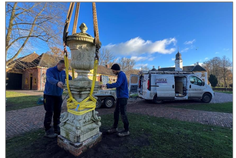
.Nieuwe fundering voor de vazen van het Scholtenfonds.

De vazen op het voorterrein die eigendom zijn van het Scholtenfonds hebben we voorzien van nieuwe fundamenteën.