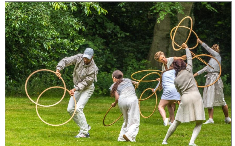
Still live in the park.

Dansers met ringen brengen als een soort levende sculptuur een ode aan verlangzaming. Met hun precieze bewegingen roepen ze beelden op van de rijzende