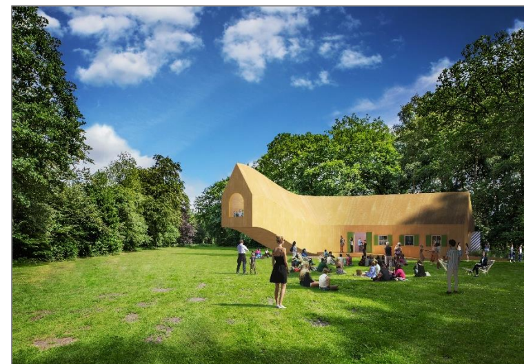
Artist impression Fuggerei folly die op de weilanden bij het Ooievaarsnest zal worden herbouwd.