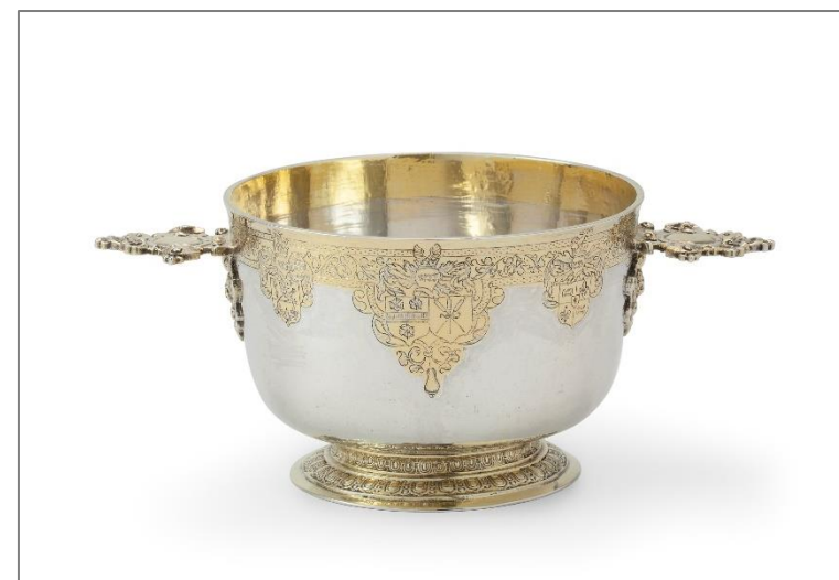
Kom van Fouwel Rengers uit Ten Post gedateerd 1610. Zilversmid Doe Freese.