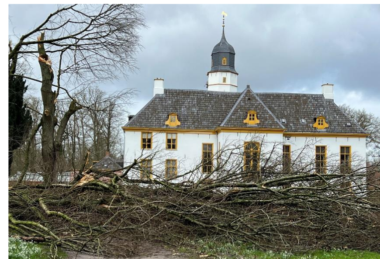
Ravage na zomerstorm waarbij een tak van de tweelingek sneuvelde.

Wij kampen met het feit dat veel bomen in het park aan het einde van hun levenscyclus zijn. Daarom hebben we in 2022 een projectplan geschreven in samenwerking met de Groene Monumentenwacht. De titel is 'Fraeylema volgens Van Hulten'. Het vervangen van de beschoeiing in de buitengracht maakt onderdeel uit van het project. Wij hebben subsidie aangevraagd bij de Provincie, GRRG. Gelijktijdig hebben wij de vergunning aangevraagd, dat bleek een veel ingewikkelder procedure dan voorheen, met veel extra onderzoeken op het gebied van ecologie en archeologie.