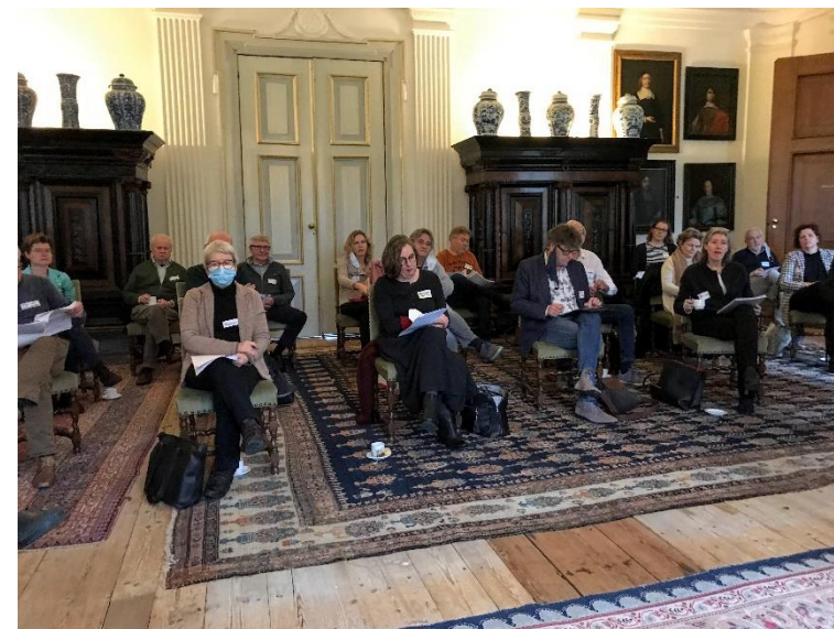
Ledenvergadering van de Coöperatie Sterke Musea in de grote zaal van de Fraylemaborg.

Daarnaast zijn waarnemingen van diverse vogelsoorten met een jaarrond beschermde nest/rustplaats bekend, waaronder de buizerd, grote bonte specht en