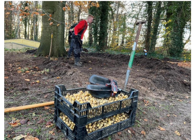
MBO Terra plant stinzenbollen.

Op de site https://stinzenflora-monitor.nl/ is te zien welke stinzenplanten er in bloei staan op het landgoed. Wekelijks wordt de site bijgehouden door de heer Theo Bekking. Wij waarderen de inspanningen van de heer Bekking zeer.