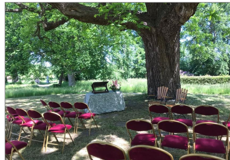
Buiten trouwen onder de zwarte walnoot.

Verschillende bruidsparen kozen ervoor om het ja-woord in de Fraeylemaborg te geven. Zowel in de Kleine Zaal als in de Grote zaal werd getrouwd. Ook al getrouwde stellen kozen, nu er weer meer mogelijk was, voor een ceremonie in de borg. Totaal kozen bijna 50 paren voor een ceremonie op het landgoed. Opnieuw was buiten trouwen, onder de Zwarte Walnoot achter de borg, erg populair.