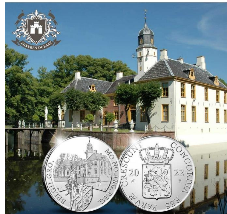
Zilveren Dukaat 350 jaar Gronings ontzet.