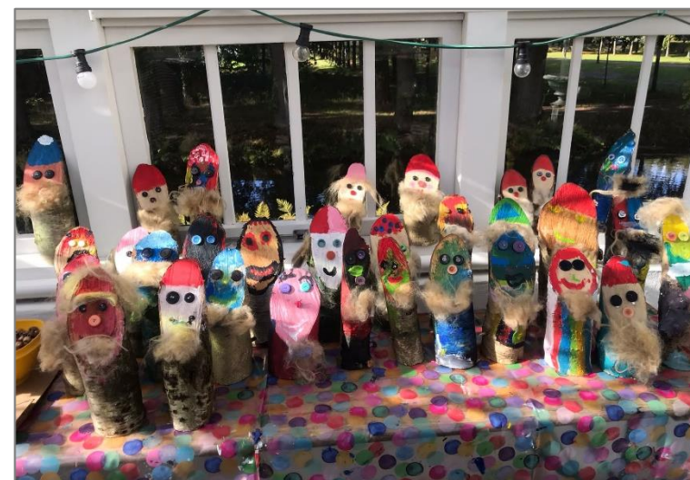
Kabouters gemaakt tijdens Oktober Kindermaand.

De zondag erna was er een wandeling voor kinderen, met quiz onderweg, naar de Fraeylemamolen. De molenaar liet kinderen de molen zien en er was een verhalenverteller die een verhaal vertelde.