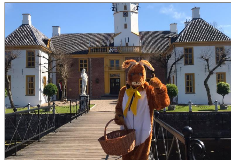
De paashaas had weer eieren verstopt.

In samenwerking met K&C Groningen en in het kader van de Culturele Mobiliteit