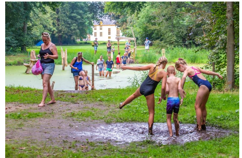
Blotevoetenpad in het park

Fijn is dat de zorgboerderij De Olle Bongerd ons twee dagen in de week helpt met het onderhoud van het park. Zo is er door leidinggevende Klaas Schipper en zijn mannen veel gewerkt aan het verwijderen van esdoorn. Zij zorgen er ook voor dat de paden goed begaanbaar blijven. En bouwden wederom een zeer succesvol Blotevoetenpad op.