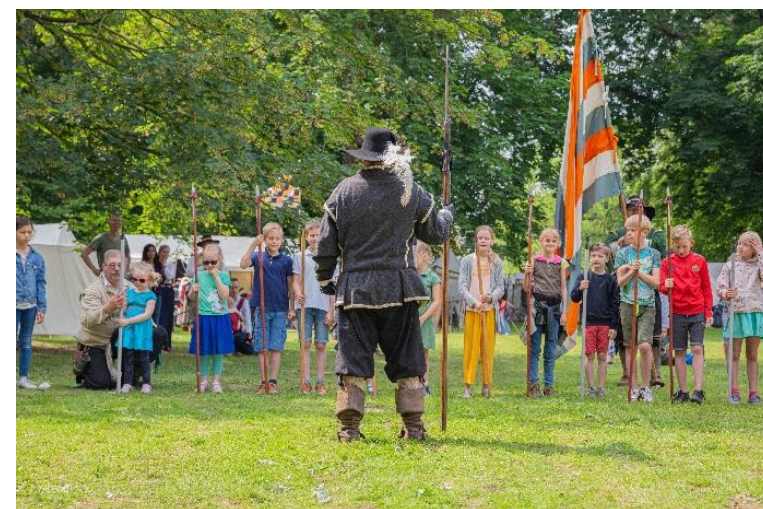
Jongeren leren hoe ze piekenier kunnen worden.

juli t/m augustus – BLOTEVOETENPAD - Er was een avontuurlijk blotevoetenpad uitgezet in het park van de Fraylemaborg. Het traject liep over zandpaden, gras,